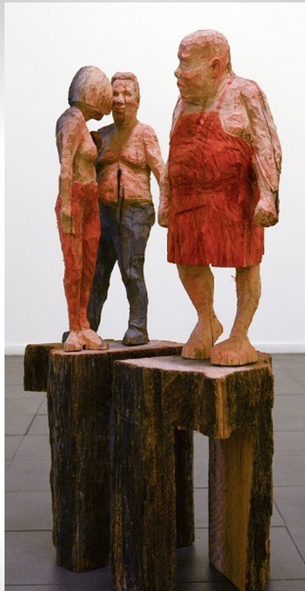
Marcar distancias Madera de eucalipto. 120 x 80 x 35 cm. 2015