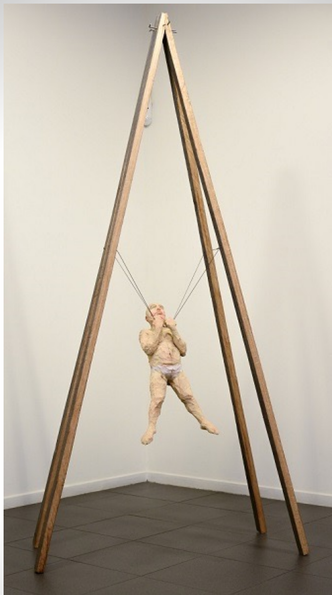
Suspensión I Madera de eucalipto. 230 x 95 x 50 cm. 2015