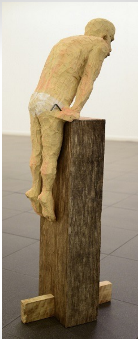
Suspensión III Madera de eucalipto. 105 x 22 x 38 cm. 2015