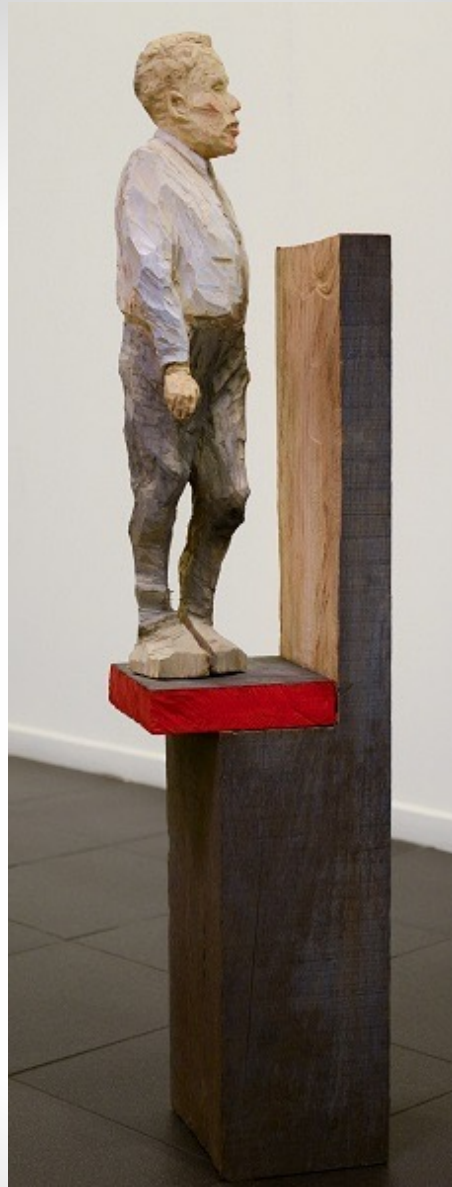
Lado soleado da rúa Madera de eucalipto. 117 x 25 x 22 cm. 2015