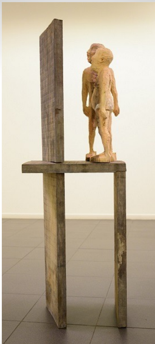
Berrar ás paredes Madera de eucalipto. 155 x 35 x 52 cm. 2015