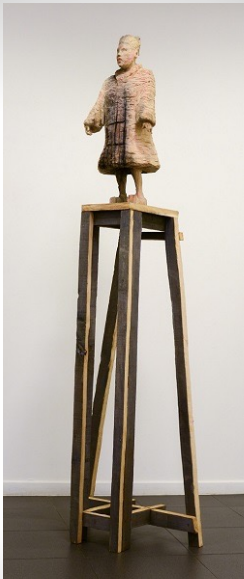
Mirar á chaira

Madera de eucalipto. 2 x 60 x 35 cm. 2015